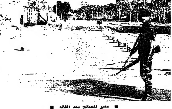
مسير المصالح بعد الفلح

حافظت محاور الجبل على نسبة ملحوظة من التوتر قبل ظهر امس وتقطعت الاشبكات وانتقلت من محور الى آخر. وشهدت محاور الضاحية والعاصمة رميات قنص محدودة تخللها بعض القذائف الصاروخية من دون ان تؤثر في حركة المار.